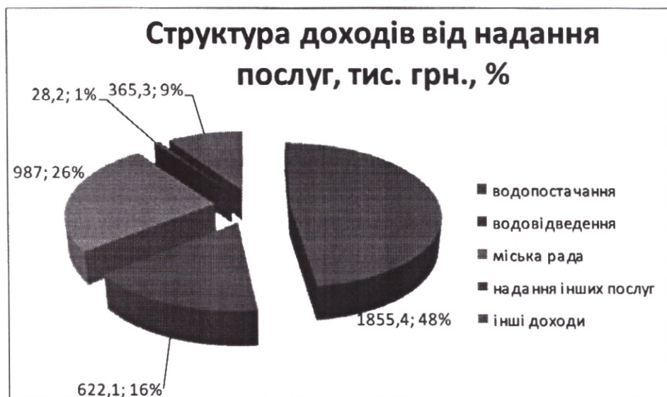
Рис. 3. Структура доходів від надання послуг КП «Водоканал» за I-й квартал 2020 року

інші операційні доходи – 365 тис. 206 грн., інші фінансові доходи – 0,1 тис. грн. (рис.3). Всього отримано доходів – на 3 млн. 858 тис. 040 грн.