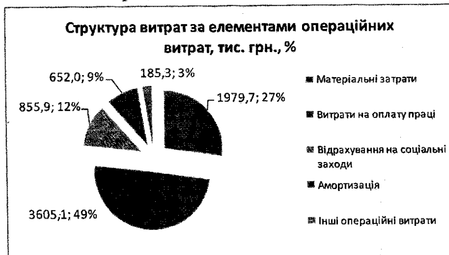
Рис. 1. Структура витрат за елементами операційних витрат КП «Водоканал» Овруцької міської ради за I-е півріччя 2021 року

Структура операційних витрат наведена на рис. 1: витрати на оплату праці складають – 3 млн. 605 тис. 100 грн. (49 %), матеріальні витрати складають – 1 млн. 979 тис. 700 грн. (27 %), відрахування на соціальні заходи – 855 тис. 900 грн. (12 %), амортизація – 652 тис. грн. (9 %), інші операційні витрати – 185 тис. 300 грн. (3 %). Всього витрат - 7 млн. 278 тис. грн., як зазначено вище.